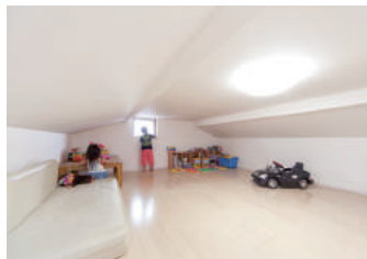
秘密基地みたいな13畳のロフト。増えがちな子どもの荷物や季節ものの収納に重宝する