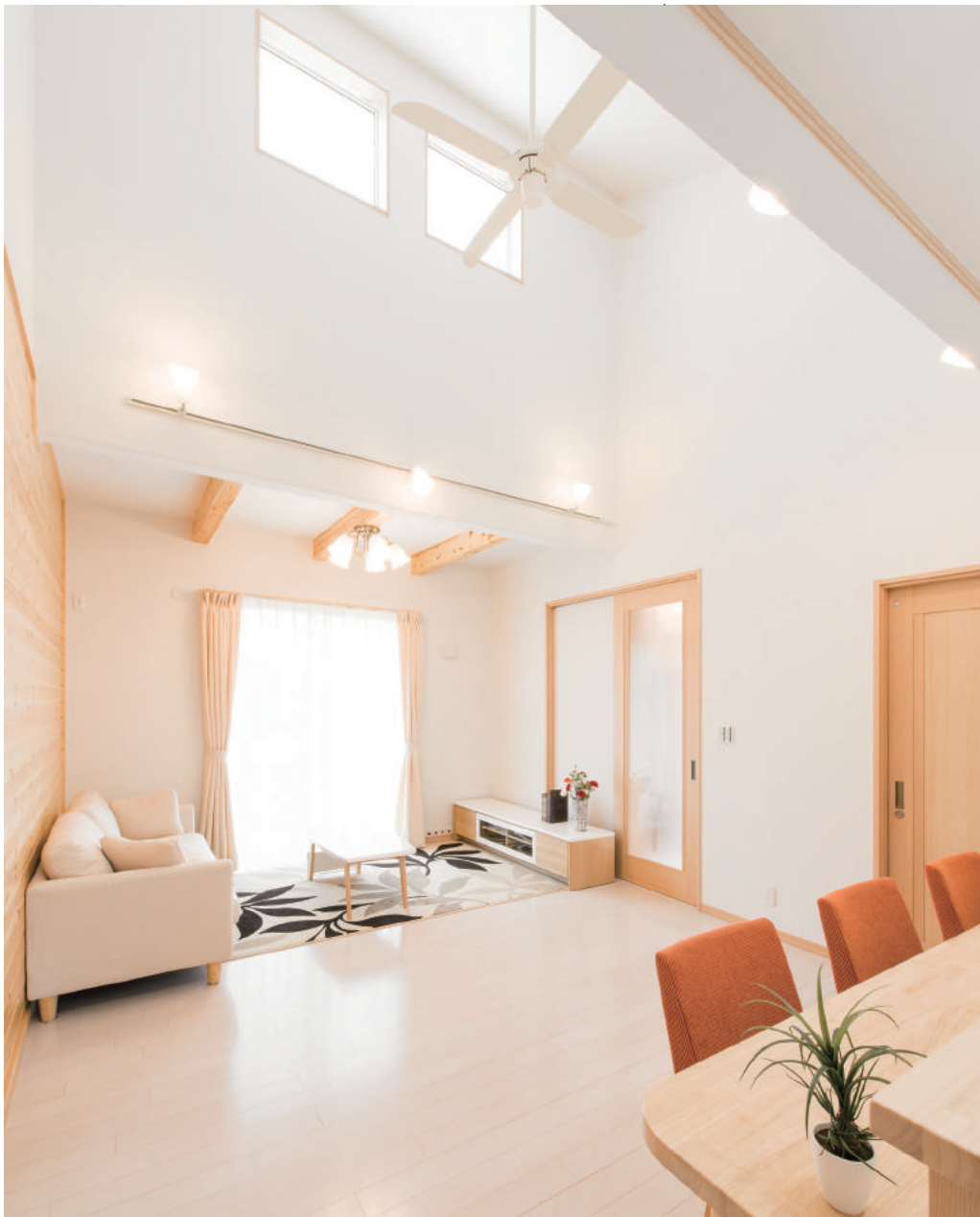
吹抜けが開放的な、白を基調にした爽やかな住まい。梁や壁の一面に効果的に木を使い、空間は健やかな印象になった。『呼吸する家』は通気断熱WB工法を採用し、ビニルクロスは一切使わず、壁が呼吸をする仕組み（見開きページの写真はすべて同社施工例）