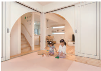
洋風の室内に合ったカラーの畳を採用した和室。LDKと繋がる子どもの遊び場にピッタリ