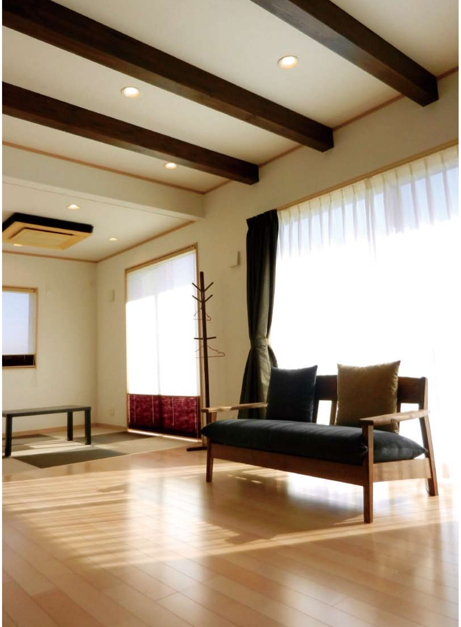
和モダンな雰囲気に仕上げたリビングは、柔らかい光が注ぐ居心地の良い空間。