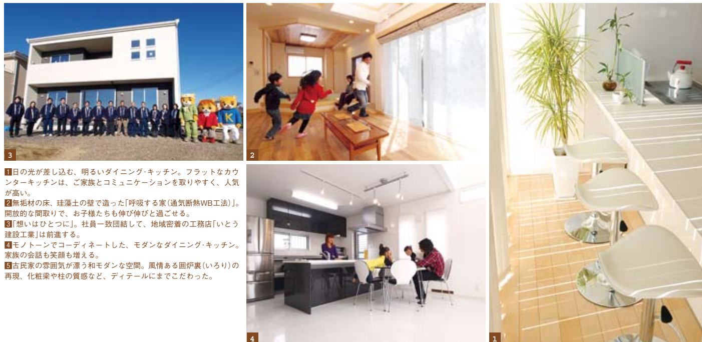
1 日の光が差し込む、明るいダイニング・キッチン。フラットなカウンターキッチン、ご家族とコミュニケーションを取りやすく、人気が高い。 2 無垢材の床、珪藻土の壁で造った「呼吸する家(通気断熱WB工法)」。開放的な間取りで、お子様たちも伸び伸びと過ごせる。 3 「想いはひとつに」。社員一致団結して、地域密着の工務店「いとう建設工業」は前進する。 4 モノトーンでコーディネートした、モダンなダイニング・キッチン。家族の会話も笑顔も増える。 5 古民家の雰囲気が漂う和モダンな空間。風情ある囲炉裏(いろり)の再現、化粧梁や柱の質感など、ディテールにまでこだわった。

私たちがつくった家は、それが存在する限りメンテナンス・アフターフォローをしていきます。それが、紹介受注率53%を誇る「地域密着型工務店」である私たち、いとう建設工業の使命であると自負しています。家の寿命は、メンテナンス次第で全く違ってきます。「工事が完了してから」お客様と私たちとの長い付き合いが始まると考え、一棟一棟、心を込めて家づくりに取り組んでいます。 私たちがつくる家は、照明器具やカーテンなど全てを含んで坪30万円台から「誰もが手の届く価格の、安全で安心して住める木の家」です。家づくりの過程で、私たちは「どれだけお客様に喜んでいただけるか」を一番大切に考えています。 施工エリアは車で1時間以内、地元工務店ならではの小回りの利く柔軟な対応を信条としています。展示場を持たない私たちが年間40棟以上を施工できるのは、地域での実績が評価されていることだと、誇りに思っています。 毎月開催している見学会は、リピーターの方も含め、多くのご家族様にご参加いただいています。ぜひ気軽に足をお運びください。スタッフ一同、心よりお待ちしております。